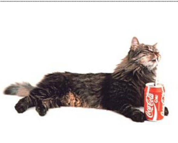
Wir trinken es auch mit Kohlensäure – wenn sonst nix da ist.