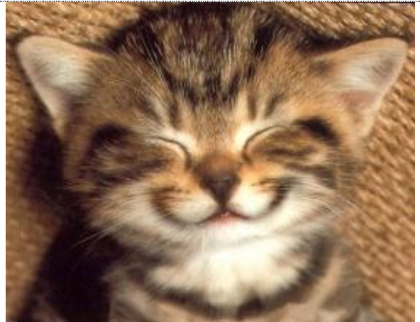
Und einen guten Schlaf.