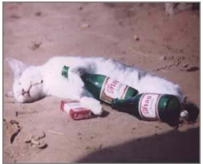
...bis wir schließlich in Ohnmacht fielen.