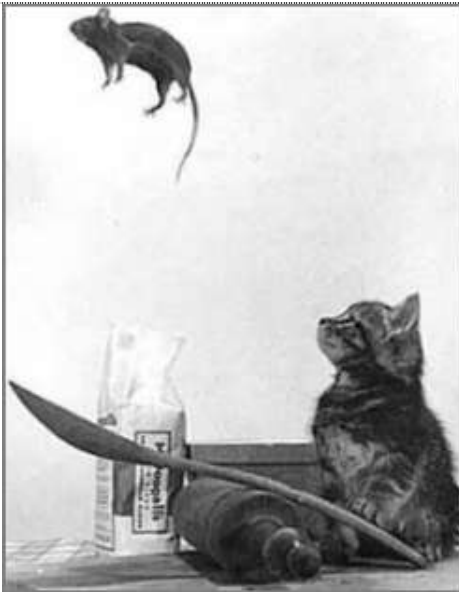
...Gruppenaktivität macht viel Spaß...