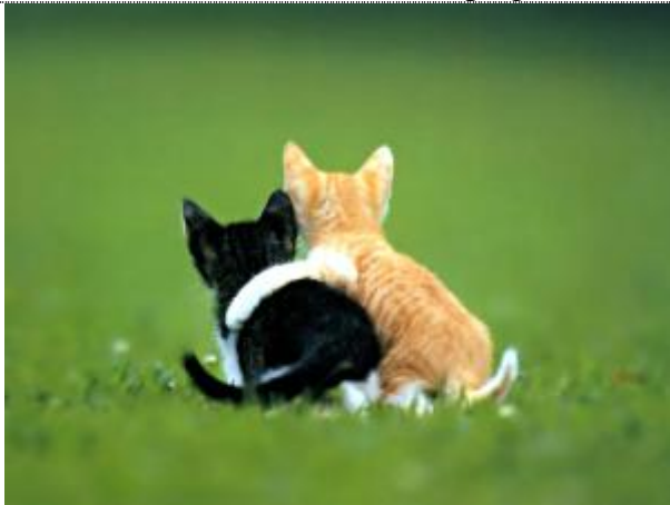
Trotz allem...es ist gut Freunde wie diese zu haben.