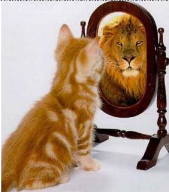
Ein letzter Blick in den Spiegel.