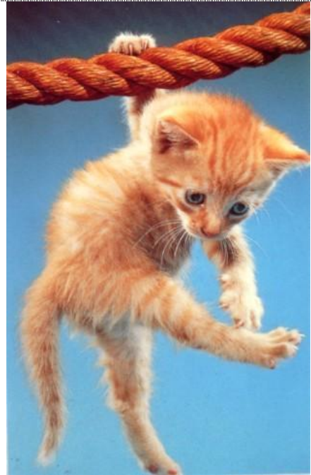
Und wir fallen nach Hause.