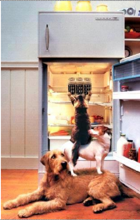
Spät Abend machten wir einen Blick in den Kühlschrank