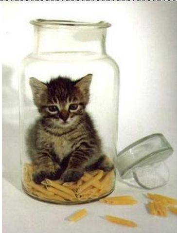
...wir spielen viele verrückte Spiele...