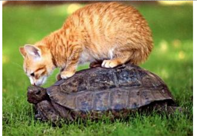
..machen neue und interessante Freunde...