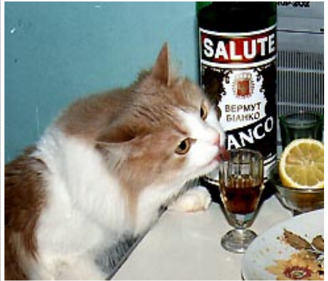
Wir haben Bier, Wein..., machen wir eine Party!