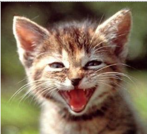
Wir sind ein bisschen verrückt...