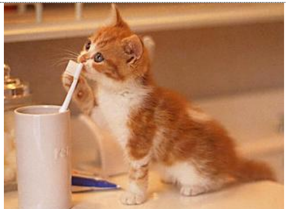
Wie wird man von diesem Geschmack befreit??