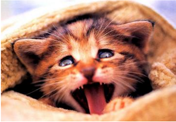
Der Morgen danach brachte den Schock – Warum brennt meine Kehle so viel?