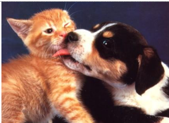
Freunde helfen dabei.