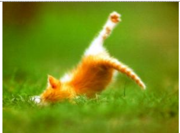
...unsere Füße machen lustige Sachen mit uns..