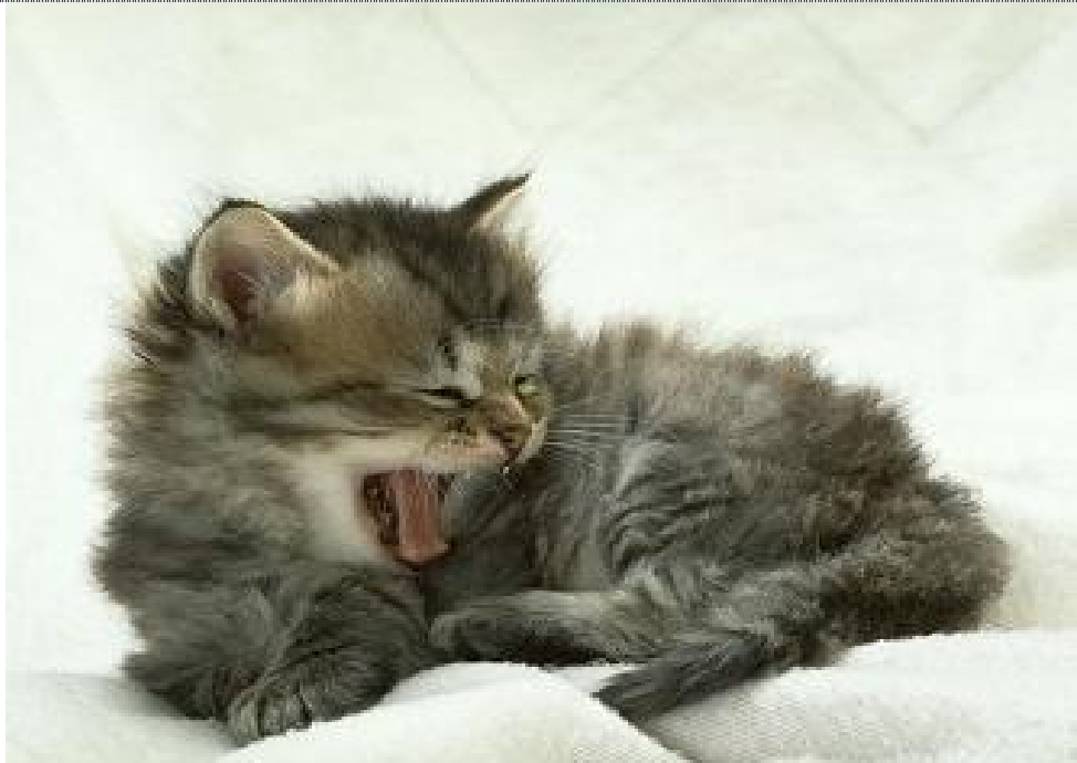
WEIL ICH HASSE DEN TAG DANACH!!!