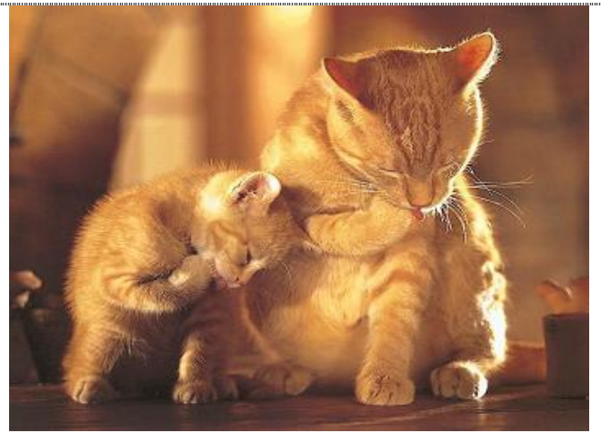
Dann ist Zeit zum Waschen.