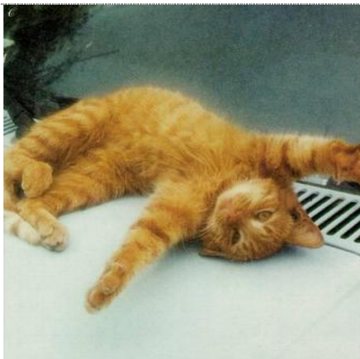
...der Boden beginnt sich zu drehen...